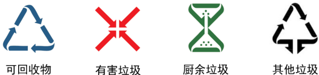
图 2-1 生活垃圾分类标志